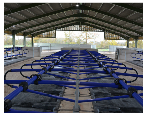
Flexibilné boxy EasyFix

Okrem uvedených boxov sú v ponuke spoločnosti aj inovatívne matrace, ktoré presne vymedzia miesto pre každú dojnicu. Sú maximálne pohodlné a nie je potrebné už inštalovať hrudnú zábranu.