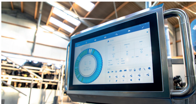
Revolučná funkcia Mission Control Dairymaster

Mission Control umožňuje pre farmára dostávať živé – reálne informácie o každej krave, ktorá je na svojom mieste v dojárni, umožňuje farmárovi urobiť špecifické úkony, ak sú potrebné. Ide o najpresnejšie údaje o každej krave počas dojenia v reálnom čase.