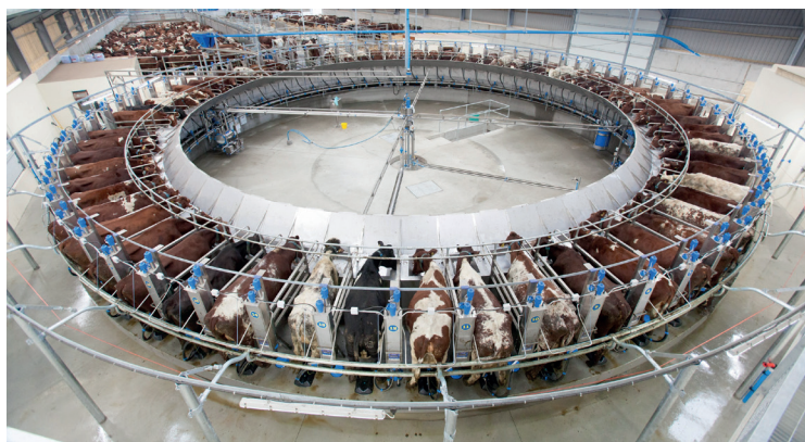
Kruhová dojáreň Dairymaster

Vďaka modulárnemu formátu produkty spoločnosti Dairymaster účinne fungujú na farmách s počtom kráv od 40 až viac ako 10 000. Mnohé z produktov spoločnosti účinne fungujú samostatne, avšak všetky produkty je možné modernizovať a integrovať do plne automatizovaného dojacieho systému s možnosťou automatického sledovania vývoja úžitkovosti jednotlivých