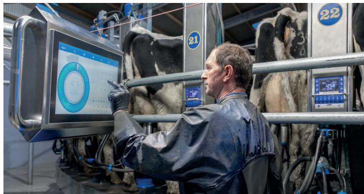
Mission Control na kruhovej dojárni